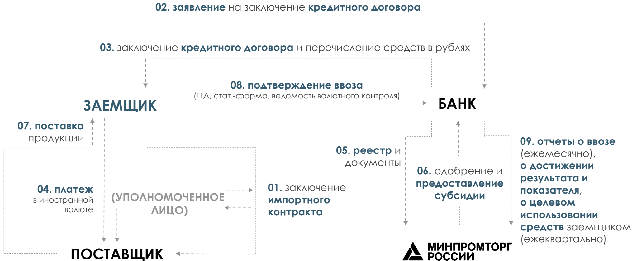
Схема механизма льготного кредитования на приобретение приоритетной для импорта продукции (для заемщика)